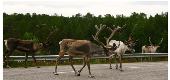
Danger ! Traversée de rennes !

Au programme : visite des alentours du lac d'Inari, paysages sauvages de Laponie, repas Sámi, troupeaux de rennes, même pas de moustiques... Par contre, attention aux rennes qui traversent inopinément la route ! Nous sommes aux aguets, caméra au poing, mais pas de soleil de minuit pour cause de nuages.