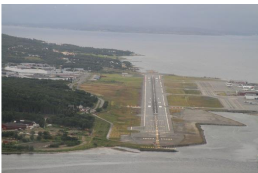
En finale à Tromsø

Le 20 juillet, des conditions météo franchement mauvaises nous incitent à être raisonnables (si si, c'est possible !) et à renoncer à atteindre Mehamn et Honningsvåg, et c'est la mort dans l'âme que nous nous résignons à rejoindre la côte nord-ouest de la Norvège sans passer par le Nordkapp. Nous sommes tout de même récompensés à partir d'Alta par les premiers fjords et après 2h10 de vol avec un vent peu favorable et quelques nuages, nous voici à Tromsø, la « capitale de l'Arctique ». Cette ville entourée de montagnes, de glaciers, de fjords, d'îles, et célèbre pour ses aurores boréales est très animée en cette soirée de week-end d'été. Toujours pas de soleil de minuit, encore pour cause de nuages et même de pluie.